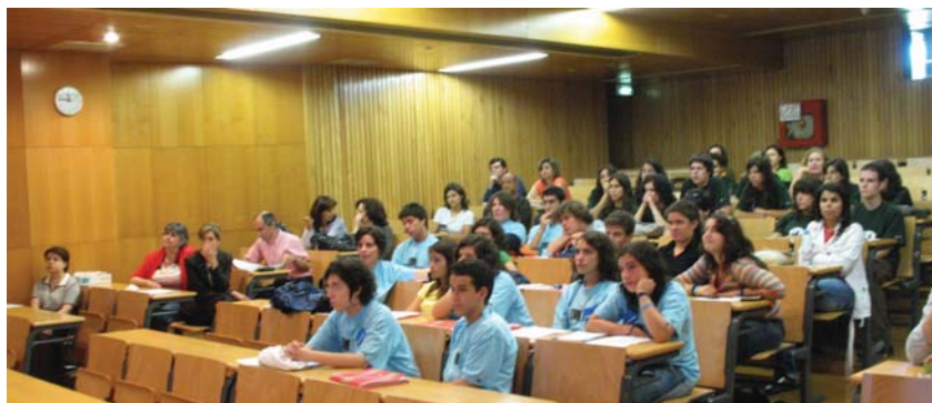
Figura 1 Vista geral dos participantes no Seminário

Dos sessenta e três candidatos à frequência desta Escola, foram seleccionados quinze jovens oriundos de diferentes concelhos do País, que tiveram um desempenho exemplar, trabalhando, ao longo da semana, em horário completo (9h 30m às 17h 30m, com intervalo de 1h 30 m para almoço e convívio). Todos ficaram instalados na Residência Universitária Novais Barbosa, com o apoio logístico de uma empresa a trabalhar para a Universidade Júnior.