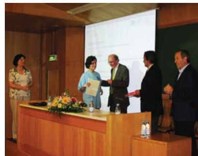
Figura 3 Entrega de diplomas

Obrigada a todos os que, de alguma forma, tornaram viável esta iniciativa.